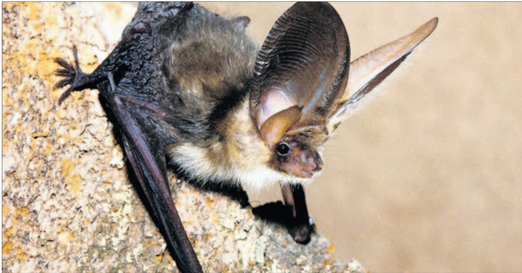
Unvermittelt tauchen sie aus dem Dunkeln auf und flössen vielen Furcht ein – doch die Fledermäuse sind absolut harmlos. Und sie brauchen Schutz.

Bülach/Hochfelden Fledermaus-Exkursion verspricht spannende Erlebnisse