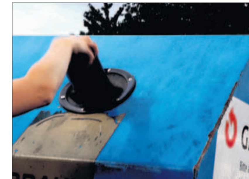
Wer spätabends noch Abfall im Glascontainer entsorgt, macht sich strafbar. (hy)

Zum einen halten sich in Höri regelmässig gewisse Leute nicht an die angeschlagenen Entsorgungszeiten von 7 bis 20 Uhr – ohne Sonn- und Feiertage. Zum andern dienen die dezentralen Abfallsammelstellen im Gentert und