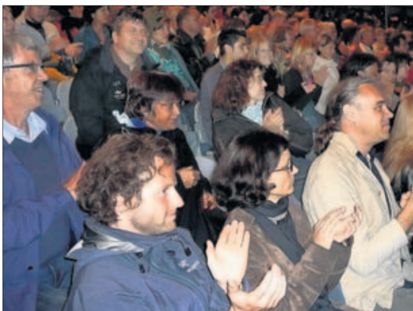
Das gelungene Spektakel «Unter Strom» lockte viel Publikum zur Jubiläumsfeier der Elektrizitätswerke Kanton Zürich nach Bülach. (and)

Das Freiluft erlebnis mit Live-Musik besticht durch spektakuläre Effekte: Teile der Kulisse brennen und explodieren, Blitze schlagen ein, Wasser spritzt und Schaum fliesst in Massen – so lange, bis das aufwändige Bühnenbild kaum wiederzuerkennen ist. (and)