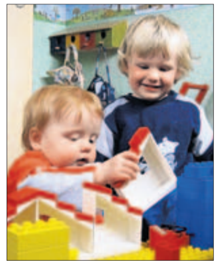
Die Kinder können spielen, während ihre Eltern dem Pfarrer zuhören. (zvg)

Etwas gesehen oder gehört: 079 422 06 46. Leser-Hinweise werden mit Fr. 30.– honoriert, wenn die Meldung in der Zeitung erscheint.